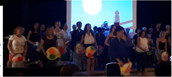
nombre de rideféens dans leur chorégraphie aux chapeaux multicolores!

D'autres présentations, comme la nôtre, ont été plus légères. Mon coup de cœur va aux Japonais, qui ont fait participer un grand