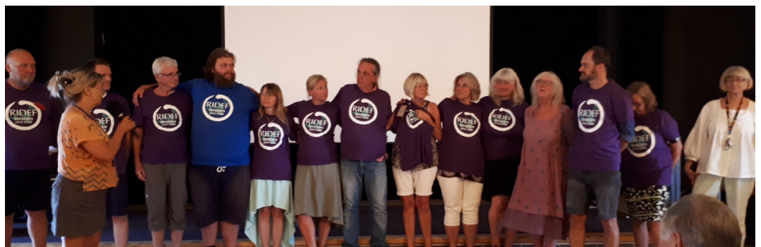
Merci à toute l'équipe d'organiseurs de la RIDEF 2018 en Suède. Lors du bilan, des participants de plusieurs pays ont nommé les problèmes survenus pendant l'événement, mais ont aussi souligné les efforts de cette équipe pour les résoudre et pour assurer à tous un séjour mémorable et enrichissant.