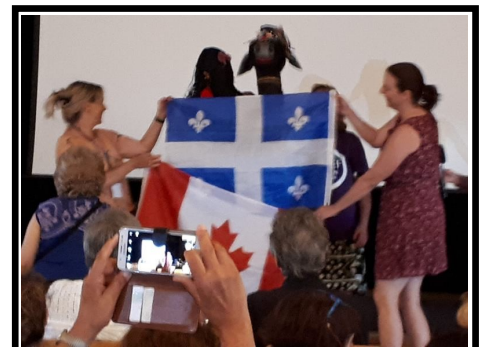
La remise du drapeau de Québec pour souligner l'organisation de la prochaine rencontre chez nous!